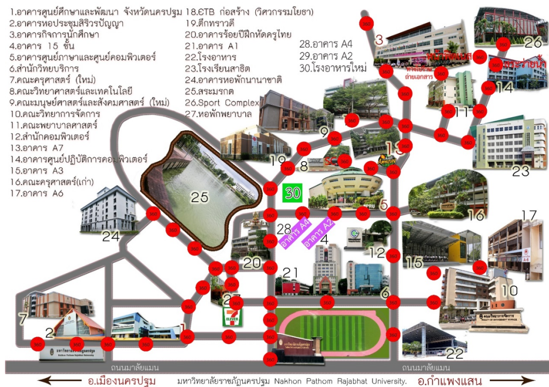
ภาพที่ 1 แสดงแผนที่บริเวณภายในมหาวิทยาลัยราชภัฏนครปฐม

ทำการวิเคราะห์ข้อมูลจากการรวบรวมข้อมูลบริเวณภายในมหาวิทยาลัยราชภัฏนครปฐม โดยจะทำการเก็บข้อมูลเป็นรูปภาพ 360 องศาหรือภาพ Panorama ในแต่ละจุดของมหาวิทยาลัยราชภัฏนครปฐมจำนวน 30 จุด และรวบรวมประวัติความเป็นมาของมหาวิทยาลัยราชภัฏนครปฐม เพื่อใช้ในการประกอบการพัฒนาการจำลองภาพให้เสมือนจริง แบบ 360 องศาเพื่อการประชาสัมพันธ์มหาวิทยาลัยราชภัฏนครปฐม