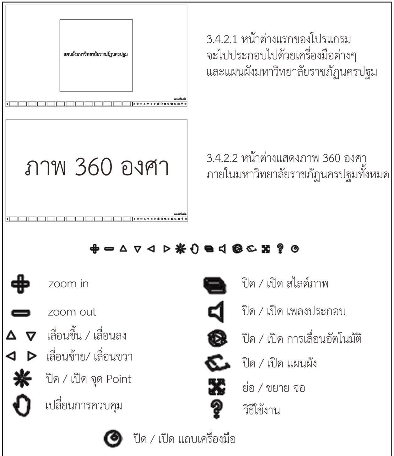
ภาพที่ 3 แสดงการออกแบบการจำลองภาพให้เสมือนจริง แบบ 360 องศา