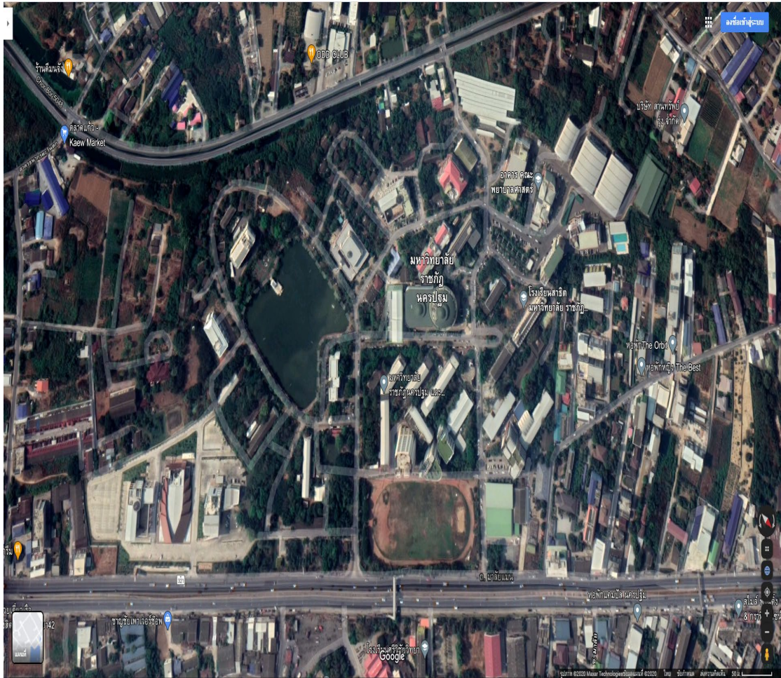
ภาพที่ 2 แสดงแผนที่ภาพ google map บริเวณภายในมหาวิทยาลัยราชภัฏนครปฐม