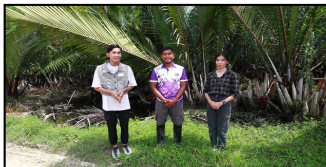
ภาพที่ 10 แสดงภาพจบรายการ