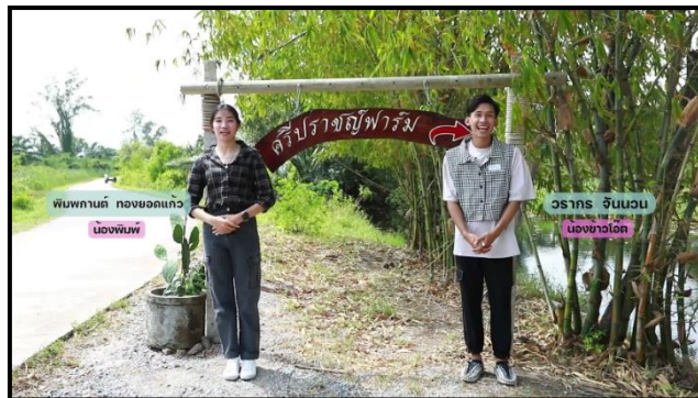
ภาพที่ 4 แสดงภาพแนะนำไฮไลท์ของรายการ