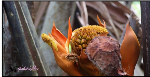
ภาพที่ 3 แสดงภาพแนะนำหัวข้อ “การท่องเที่ยวเชิงเกษตร”