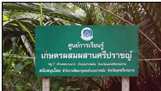
ภาพที่ 5 แสดงภาพแนะนำความเป็นมาของศรีปราชญ์ฟาร์ม