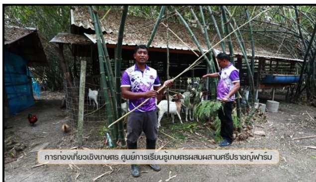
ภาพที่ 6 แสดงภาพแนะนำโซนปศุสัตว์