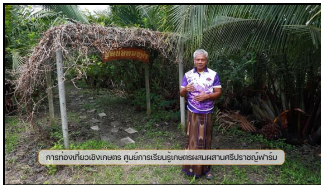
ภาพที่ 8 แสดงภาพแนะนำ “คั้นบ่อทองคำ”