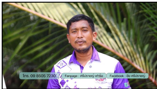
ภาพที่ 9 แสดงภาพช่องทางการติดต่อ