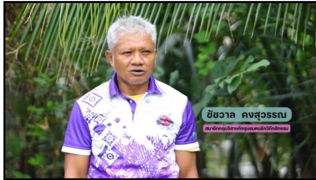
ภาพที่ 7 แสดงภาพแนะนำ “ป่า 3 อย่าง ประโยชน์ 4 อย่าง”